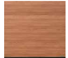
22 Noce sorrento natur