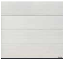
35 Biały dąb