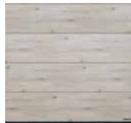
38 Dąb bielony