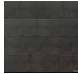
10 Grigio scuro