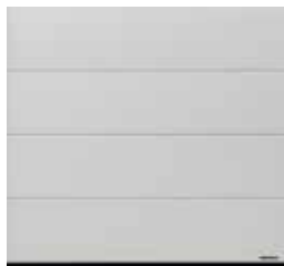
34 Biały szcztokowany