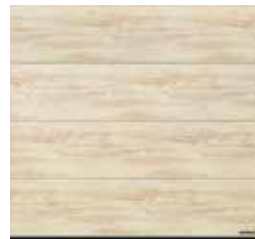
28 Przetarte drewno