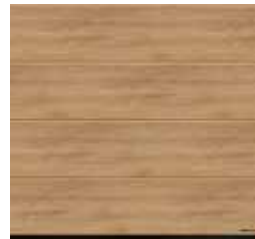
19 Malt Oak .NOWOŚĆ