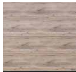
36 Biały olejowany dąb