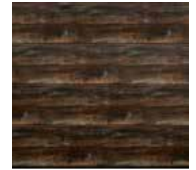
14 Spalony dąb