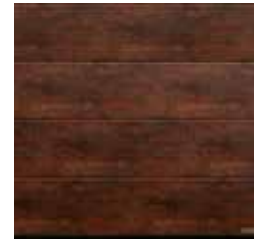
12 Zardzewiała stal