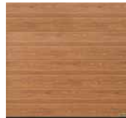
30 Drewno tekowe