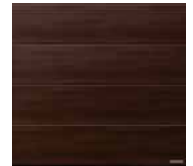
33 Orzech włoski terra