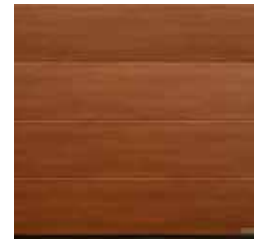
21 Noce sorrento balsamico